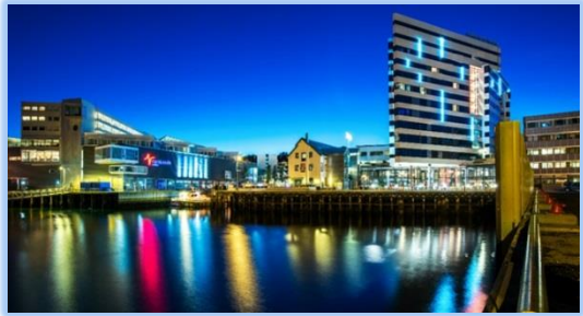
Clarion Hotel The Edge, Tromsøs største kongress- og konferansehotell